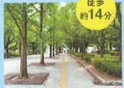
高砂市総合運動公園