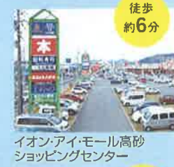
イオン・アイモール高砂ショッピングセンター