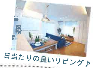
日当たりの良いリビング♪