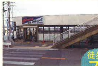
マルアイ王塚台店