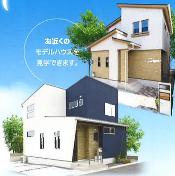
外観完成イメージパース