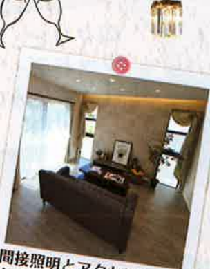
間接照明とアクセント クロスで上品な内装に♪