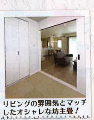
リビングの雰囲気とマッチ したオシャレな坊主畳!