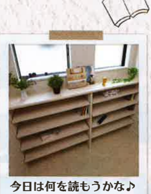
今日は何をしようかな♪ ファミリーライブラリー