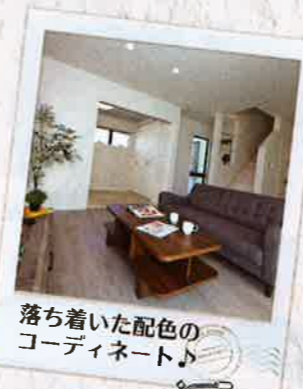
落ち着いた配色の コーディネート♪