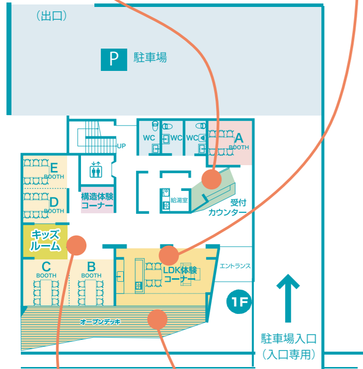
配置図兼1階平面図