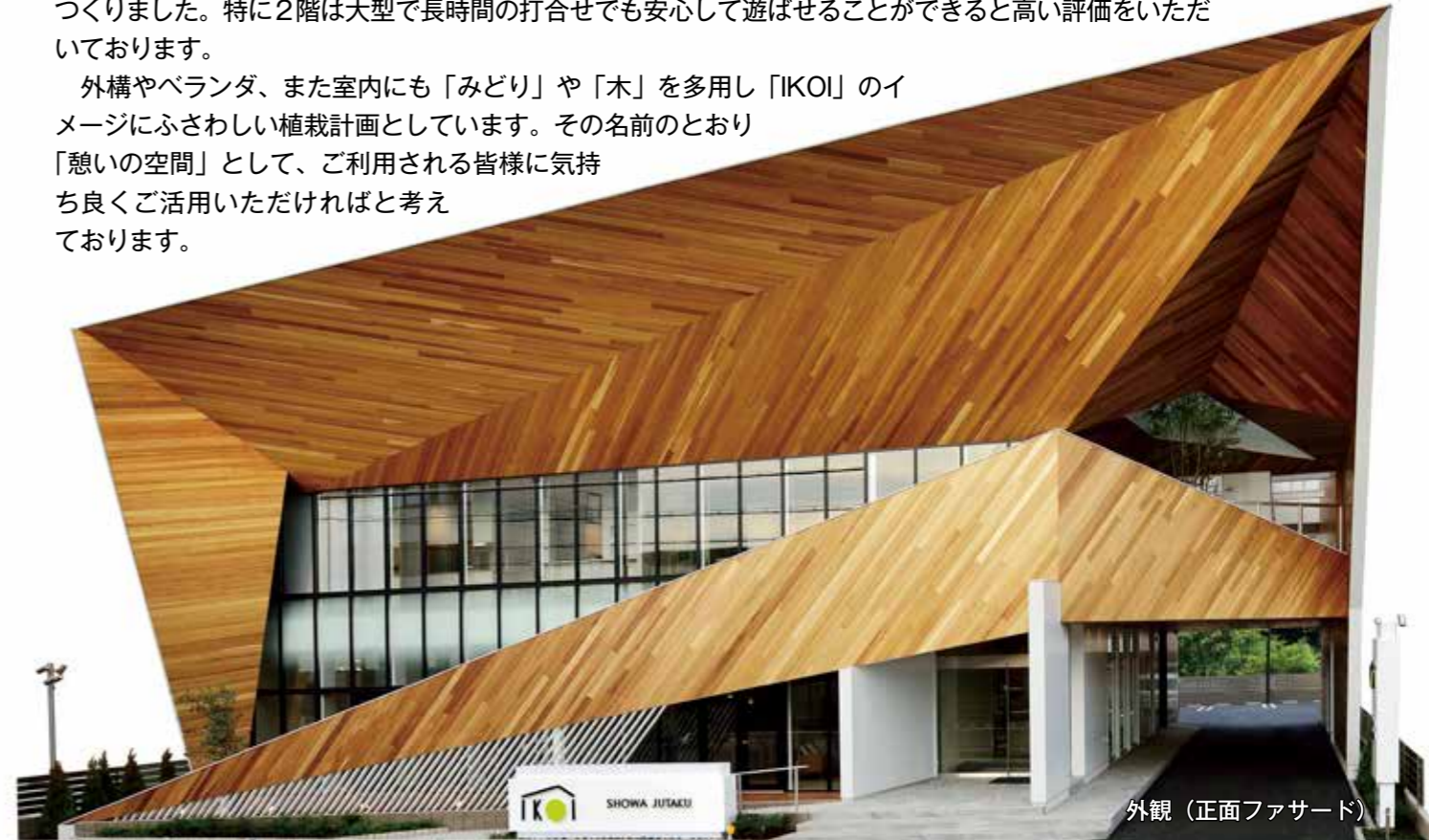
外観 (正面ファサード)

外構やベランダ、また室内にも「みどり」や「木」を多用し「IKOI」のイメージにふさわしい植栽計画としています。その名前のとおり「憩いの空間」として、ご利用される皆様に気持ち良くご利用いただければと考えております。